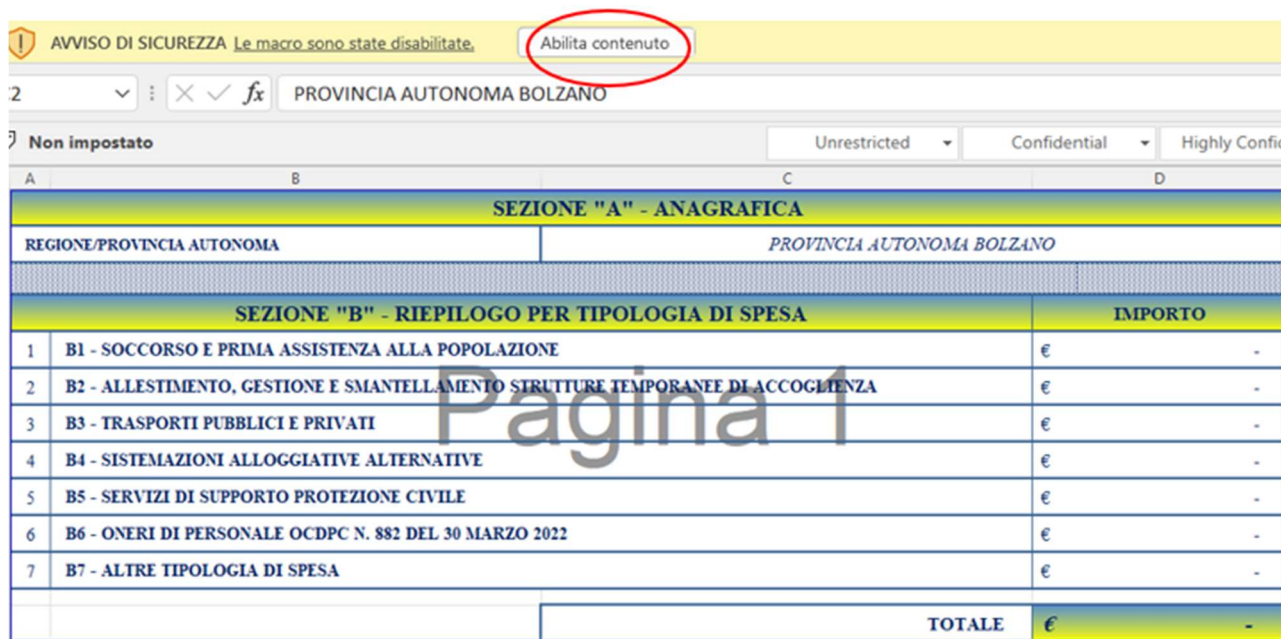
Figura 2 – Funzione “Abilita contenuto”

Si forniscono di seguito le istruzioni di dettaglio per la compilazione delle singole schede.